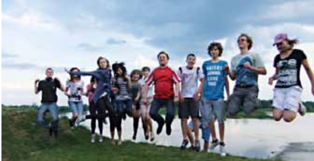
Odrzańska Rada Młodzieży: Kreatywność i świeże pomysły przeciwko emigracji młodych ludzi