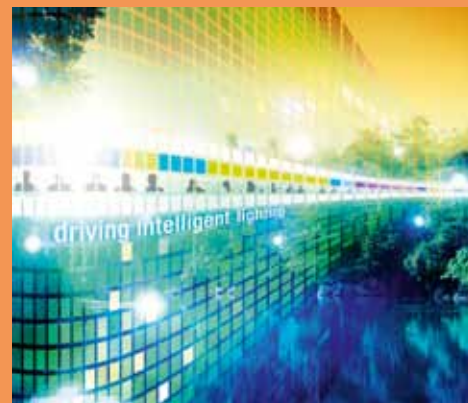
Inteligentne miasto: rynkowe szanse dla przedsiębiorstw IT