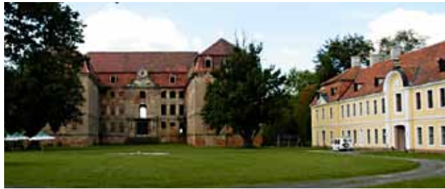
Pałac w Brodach – wspólne dziedzictwo kulturowe

rozwoju ponadgranicznego publicznego transportu zbiorowego i do nadania biletowi EURO-NYSA zmiany jakościowej: dotychczasowa współpraca z partnerami publicznego transportu zbiorowego w Polsce i Czechach, oparta na zasadzie dobrowolności, ma zyskać charakter współpracy instytucjonalnej, a co za tym idzie – wiążącej.