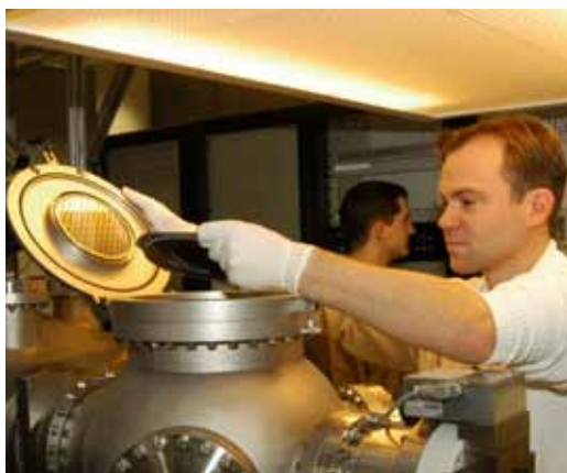
Próźniowe pokrywanie substratu w aparaturze utwardzającej

Narodowe Centrum Badań i Rozwoju (NCBiR), agencja wykonawcza polskiego Ministerstwa Nauki i Szkolnictwa Wyższego, oraz Administracja Senacka ds. Gospodarki, Technologii i Badań Naukowych kraju związkowego Berlina podpisały w dniu 20 sierpnia br. umowę o współpracy. Umożliwi ona wspólne finansowanie projektów naukowych i rozwojowych z dziedziny technologii optycznych. Ponieważ branża technologii optycznych w Polsce skupiona jest w zasadzie w Warszawie i wokół niej, w pierwszej linii ze współpracy korzyści czerpać będą regiony stołeczne.