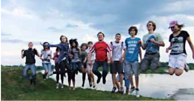
Odrzańska Rada Młodzieży: Kreatywność i świeże pomysły przeciwko emigracji młodych ludzi