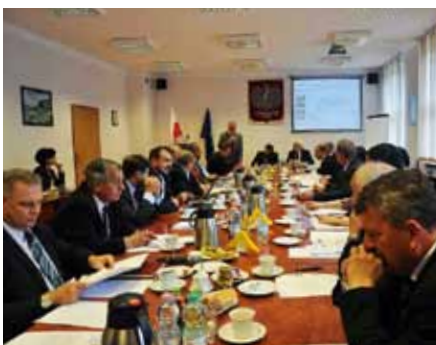
Uroczystość inauguracyjna EUWT w Wlkp.

Proces tworzenia Eurodystryktu „TransOderana EUWT” wkroczył w ostatni etap. W ubiegłych miesiącach inicjatorzy zabiegali u polskich oraz niemieckich gmin i powiatów o czynne wsparcie projektu. Rezultat: do tej pory przyłączyło się po polskiej stronie dziesięć, a po niemieckiej dwanaście podmiotów regionalnych.