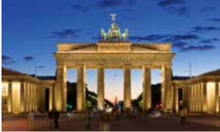
Symbol Berlina: Brama Brandenburska

Poznań i Berlin postrzegają siebie jako międzynarodowe metropolie z szeregiem podobnych wyzwań w dziedzinie rozwoju miasta i ochrony środowiska.