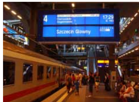
Zmiany w rozkładzie jazdy między Polską a Niemcami

Między Wrocławiem a Drezniem pozostają trzy połączenia dziennie. Czas jazdy uległ zmianie o około 30 minut, co zapewni w Zgorzelcu lepsze połączenia z Berlinem i Cottbus w kierunku Wrocławia i odwrotnie.