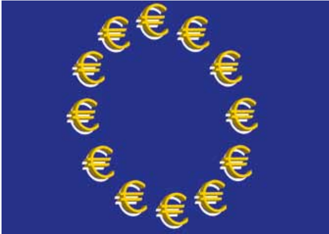
Celowe wykorzystanie funduszy UE we współpracy polsko-niemieckiej

Przedstawiciele regionów Partnerstwa-Odra oraz rządów Polski i Niemiec spotkali się 4 września br. w Poczdamie, aby wymienić się doświadczeniami w dziedzinie polityki spójności UE w ramach Partnerstwa-Odra.