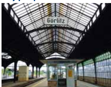
Dworzec graniczny w Zgorzelcu

14 listopada br. ministrowie transportu Polski i Niemiec podpisali polsko-niemiecką umowę o współpracy w dziedzinie komunikacji kolejowej.