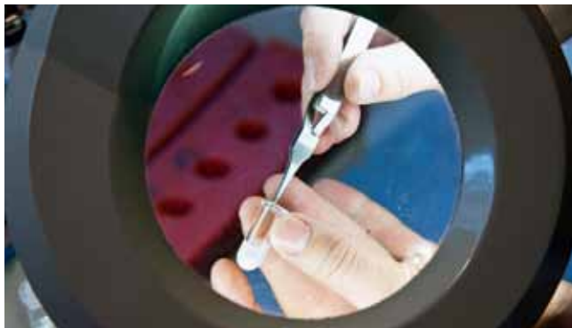
Wydajny mikroskop świetlny w laboratorium preparatyki centrum mikroskopów elektronicznych

Współpraca z Polską, przede wszystkim w regionie nadodrzańskim, jest dla Berlina ważnym czynnikiem gospodarczym. Ponieważ Berlin jest wyłączonej z transgranicznej kooperacji, na początku okresu finansowania 2007–2013 istniała konieczność zintegrowania międzyregionalnego instrumentu wspierania jakim jest program „Tworzenie Sieci w Europie Środkowej i Wschodniej” z programem operacyjnym EFRR dla Berlina. Jest finansowany ze środków funduszy strukturalnych i środków kraju związkowego Berlina.