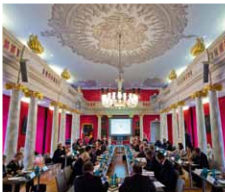
Polityczne spotkanie na szczycie w auli uniwersytetu w Greifswaldzie

W dniach 20 i 21 listopada br. w Greifswaldzie, na zaproszenie Premiera Meklemburgii-Pomorza Przedniego Erwina Selleringa, odbyło się czwarte polityczne spotkanie na szczycie Partnerstwa-Odra. Obecni byli przedstawiciele wszystkich ośmiu regionów, polskiego rządu oraz Ministerstwa Spraw Zagranicznych Niemiec.