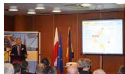
Konferencja energetyczna we Wrocławiu

lityki Energetycznej w Ministerstwie Gospodarki i Spraw Europejskich Brandenburgii wskazał na potencjał współpracy w przypadku węgla brunatnego – oba regiony posiadają bowiem jego ogromne zasoby.