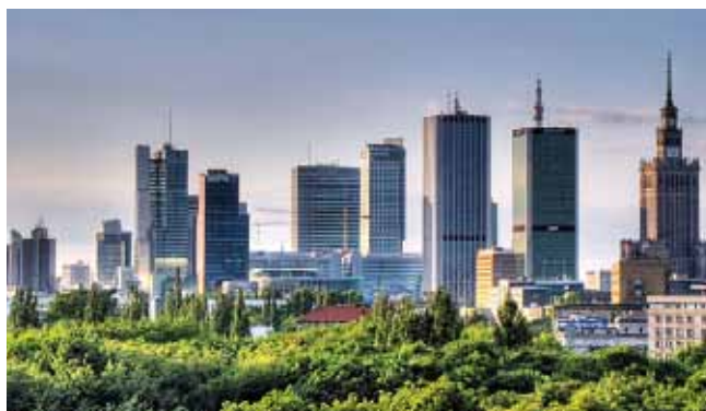
Skyline w Warszawie