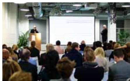
Konferencja designu w Poznaniu

wotnie zlecenie berlińskiej agencji Design-agentur e27 na stworzenia lampy. Współpraca doprowadziła do całkowitej przebudowy wizerunku przedsiębiorstwa oraz nowego asortymentu produktów, które doprowadziły do nieoczekiwanego sukcesu rynkowego.