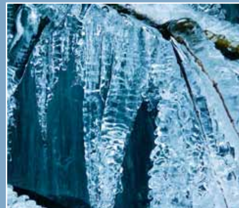
Zimowe pozdrowienia z okazji Nowego Roku!