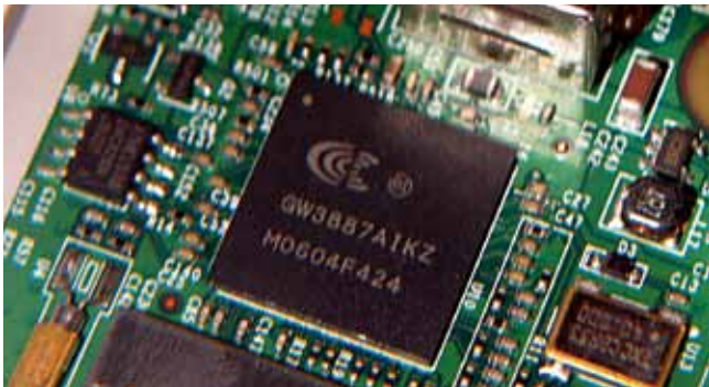
Mikrochipy są dziś wykorzystywane w dziedzinie kontroli i bezpieczeństwa

Ścisłejsze połączenie lokalizacji ICT Berlin-Brandenburgia z Polską – to cel projektu, który zainicjował klaster ICT/Media/Gospodarka Kreatywna Berlina-Brandenburgii. Projekt jest finansowany ze środków EFRR i środków krajowych z berlińskiego programu „Tworzenie Sieci w Europie Środkowej i Wschodniej“.