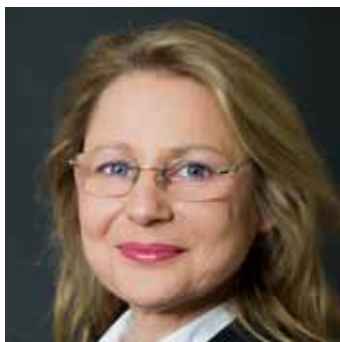
Senator ds. Gospodarki Cornelia Yzer

Cornelia Yzer jest nową Senator ds. Gospodarki, Technologii i Badań Naukowych w Berlinie. Senator za jej priorytetowe zadanie obrała rozwój Berlina jako ośrodka przemysłowego i metropolii gospodarczej w regionie. Szczególną uwagę chce poświęcić wsparciu rozwoju technologii i reklamie Berlina jako miejsca lokalizacji branż technologicznych i innowacyjnych. Chce przy tym bardziej celowo docierać do inwestorów