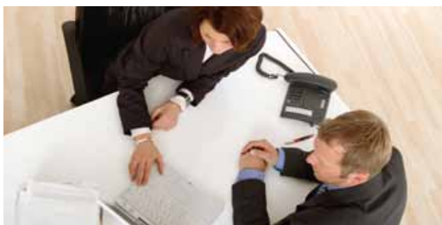
Małe i średnie przedsiębiorstwa tworzą wiele innowacji

Wzmocnienie innowacji w regionie poprzez współpracę międzyregionalną było ważnym priorytetem w działaniach Funduszu Rozwoju i Promocji Województwa Wielkopolskiego S.A. (FRIPWW) w bieżącym okresie budżetowym Europejskiego Funduszu Rozwoju Regionalnego (EFRR). Szczególną wagę FRIPWW poświęcił wspieraniu innowacyjnych MŚP oraz zapewnieniu odpowiednich instrumentów finansowania. Cenne doświadczenie dla województwa przyniósł udział w projekcie INTERREG IV-B-BSR JOSEFIN, w którym oprócz Wielkopolski zaangażowanych było pozostałych trzech partnerów, silnie powiązanych z regionem nadodrzańskim.