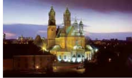
Symbol Poznania: Katedra na wyspie Ostrów Tumski

Administracji Senackiej ds. Rozwoju Miasta i Środowiska przybyła trzynastoosobowa delegacja administracji Poznania. Uczestnicy warsztatów mogli zapoznać się z koncepcjami gospodarczego wykorzystania regionów nadrzecznych w mieście i projektowania atrakcyjnych terenów wodnych w Berlinie.