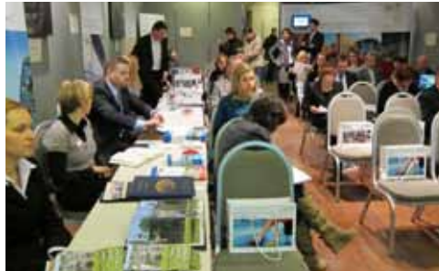
Workshop „Kraina Odry“

25 i 26 lutego 2011 r. w Poznaniu i Berlinie odbył się transgraniczny workshop przemysłu turystycznego. Zorganizowany został przez Niemiecką Centralę Turystyczną (DZT) i Polską Organizację Turystyczną (POT) na podstawie zawartego w marcu 2009 r. pomiędzy dwoma związkami porozumienia o współpracy. Przewiduje ono jako istotę projektu marketing regionów przygranicznych obu krajów jako wspólnej, atrakcyjnej turystycznej destynacji „Kraina Odry“.