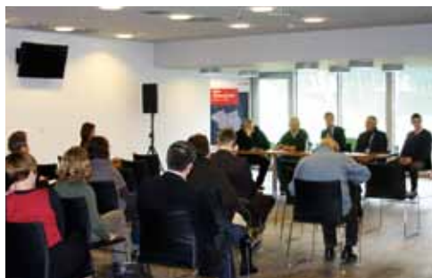
Workshop sieciowy na stadionie we Wrocławiu

Ważnym celem kooperacji turystycznej Partnerstwa-Odra jest włączenie do współpracy regionalnych metropolii, nawet jeśli one same nie są członkami kooperacji. Z tego powodu zorganizowano dwa workshopy sieciowe: pierwszy 18 i 19 maja 2011 r. w Poznaniu, drugi 28 listopada 2011 r. we Wrocławiu. Workshopy zostały zaplanowane jako pierwsze spotkania z całego rzędu imprez. Mają się one odbywać raz w roku w Poznaniu i we Wrocławiu w formie prezentacji i panelu dyskusyjnego z różnorodnymi tematami. Mają one doprowadzić do zbliżenia się Berlina i Poznania wzgl. Wrocławia w zakresie marketingu turystycznego.