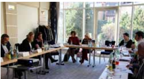
Spotkanie partnerów w listopadzie 2011 r. w Poczdamie

Najważniejszym instrumentem do głosowania nad celami kooperacji i wyznaczonych działań partnerów projektu są kwartalne spotkania. Każde spotkanie odbywa się w innym mieście regionu nadodrzańskiego, dzięki temu wszystkie regiony mają okazję zaprezentować się partnerom projektu. Początkowo w spotkaniach obok visitBerlin udział brali czterej polscy partnerzy oraz TMB Tourismus-Marketing Brandenburg Sp. z o.o. Stowarzyszenia turystyczne z Meklemburgii-Pomorza Przedniego i Saksonii dołączyły na późniejszych spotkaniach. Odbyło się to zgodnie ze strategią lidera partnerów: najpierw stworzenie ponadgranicznych kontaktów i po ich umocnieniu włączenie wszystkich niemieckich partnerów projektu.